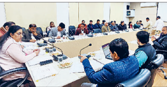
भिवानी। सीएम विंडो की शिकायतों की समीक्षा बैठक में डीसी व अन्य अधिकारी।