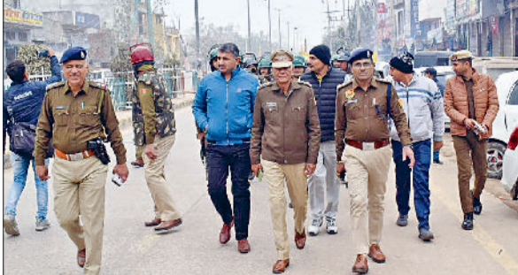
भिवानी। शहर में पैदल मार्च निकालते पुलिसकर्मियों।

पुलिसकर्मियों के साथ पैदल मार्च शुरू हुआ। पुलिस ने पैदल मार्च महिला थाना से शुरू किया, जो भागवान परशुराम चौक, सरदार झाड़ू सिंह चौक, झज्जर घाटी, रंगीला हनुमान मन्दिर, पंचनन्द चौक, गौशाला चौक, बाल्मीकि नगर, कबीर नगर, बधवाना गेट, छोटी बाजारी, हीरा चौक, झाड़ू सिंह चौक, भगवान परशुराम चौक होते हुए महिला थाना में संपन्न हुआ। डीएसपी ने जगह-जगह पर स्थानीय नागरिकों व दुकानदारों से बातचीत कर समस्याएं जानी और संबंधित