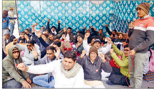
भिवानी। बृहस्पतिवार को मांगों को लेकर उपायुक्त कार्यालय के बाहर और चरखी दादरी में नारेबाजी करते पटवारी।