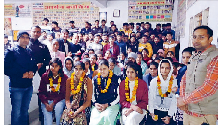
मिवाणी। आर्यन कोचिंग के शिक्षकों के साथ सफल अभ्यर्थी।