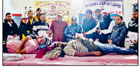
मिवाणी। रक्तदाताओं को बेज लगाते अतिथि।