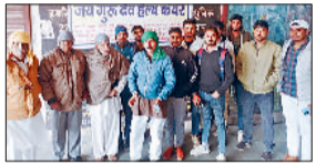
तोशाम। पंचायत के फैसले की जानकारी देते किसान मोर्चा के पदाधिकारी।