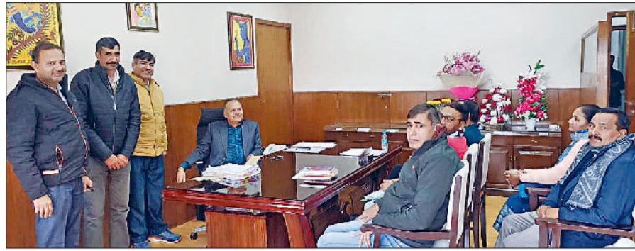
मिवाणी। अधिकारी के साथ बातचीत करते प्रतिनिधिमंडल के सदस्य।

सर्व कर्मचारी संघ से संबद्ध हरियाणा एजुकेशन मिनिस्ट्रीयल स्टाफ एसोसिएशन के पांच सदस्यीय प्रतिनिधिमंडल की एडीशनल डायरेक्टर प्रशासन के साथ शिक्षा सदन पंचकूला में लगभग दो घंटे तक वार्ता मीटिंग चली। प्रतिनिधिमंडल ने अधिकारी