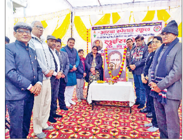
मिवाणी। ब्रेल लिपि के अविष्कारक लुईस ब्रेल को नमन करते अतिथिगण व लुईस ब्रेल के जन्मदिवस पर हरियाणवी नृत्य की प्रस्तुति देती दिव्यांग छात्राएं।