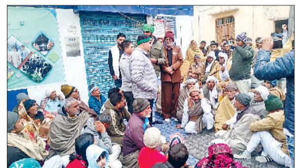
बवानीखेड़ा। मांगों को लेकर बैंक के आगे बैठे किसान व अन्य।