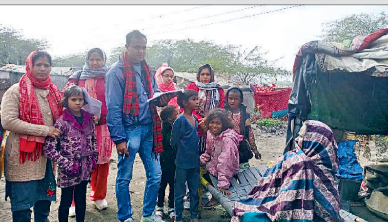
चरखी दादरी। झुग्गी झोपड़ी में सर्वे करते शिक्षा विभाग के कर्मचारी।

शिक्षा विभाग की तरफ से प्रयास किया जा रहा है कि हर बच्चे का स्कूल में दाखिला हो। किन्हीं कम से जो बच्चा स्कूल छोड़ चुका है उसको भी दोबारा स्कूल में दाखिला करवाया जाएगा। सर्वे में पाया गया है कि शहर में सैकड़ों बच्चों ने अब तक दाखिला नहीं लिया है। इन बच्चों के परिजन पढ़ाई को लेकर गंभीर नहीं हैं। बच्चों से मजदूरी करवाते हैं। शहर की झुग्गी बस्तियों में रहने वाले बच्चों के लिए व्यवस्थित और सुनियोजित प्रारंभिक शिक्षा की पूर्ण व्यवस्था हो। आज आवश्यकता आयुवर्ग के बच्चों की क्षमताएं आवश्यकता तथा गहनशीलता के स्तर को देखते हुए पूर्व प्राथमिक शिक्षा का एक ऐसा कार्यक्रम तैयार किया जाए जो बच्चों के परिवेश व परिस्थितियों के अनुकूल हो। उनके विकास को गति प्रदान करे।